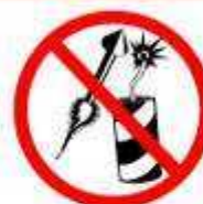
MATERIAL EXPLOSIVO / PIROTÉCNICO FIREWORKS / EXPLOSIVE MATERIAL