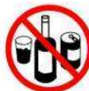
COPOS / GARRAFAS / LATAS GLASSES / BOTTLES / CANS