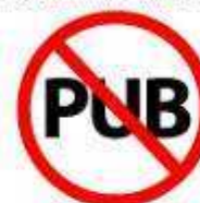
MATERIAL COMERCIAL COMMERCIAL MATERIAL