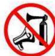
ALTIFALANTES / BUZINAS DE AR COMPRIMIDO LOUDSPEAKERS / AIR HORNS