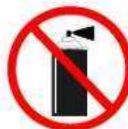
LATAS DE GÁS GAS CANNISTERS