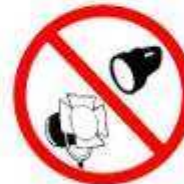
DISPOSITIVOS LUMINOSOS LIGHT DEVICES

ASSIM COMO QUAISQUER OBJECTOS QUE POSSAM INCITAR À VIOLÊNCIA OU À DISCRIMINAÇÃO, CAUSAR FERIMENTOS OU IMPEDIR A VISIBILIDADE DOS ESPECTADORES.