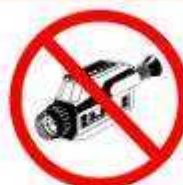
CÁMARAS DE FILMAR VIDEO CAMERAS