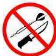
DARDOS E FACAS DARTS AND KNIVES