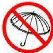
CHAPÉUS DE CHUVA UMBRELLAS