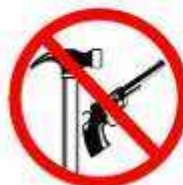
FERRAMENTAS E ARMAS TOOLS AND WEAPONS