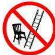
CADEIRAS E ESCADAS CHAIRS AND LADDERS