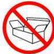
CAIXAS E EMBALAGENS BOXES AND PACKAGING