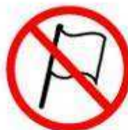
HASTES RÍGIDAS FLAGPOLES