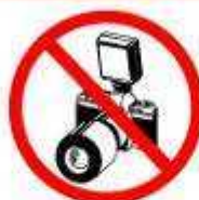
MÁQUINAS FOTOGRÁFICAS COM TELEOBJECTIVA LONG LENS CAMERAS