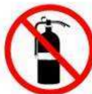
EXTINTORES FIRE EXTINGUISHERS